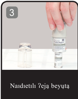
Naidıetılı ?ejá beyúta