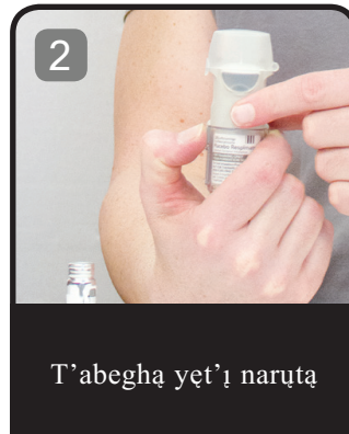
T'abeghá yet'ı narúta