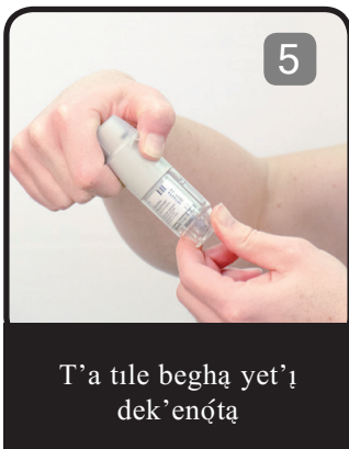
T'a tile beghá yet'ı dek'enótá