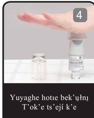
Yuyaghe hotie bek'úhı T'ok'e ts'ejı k'e