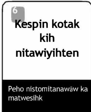
6 Kespin kotak kih nitawiyihten Peho nistomitanawaw ka matwesihk