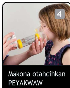
4 Mākona otahcihkan PEYAKWAW