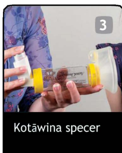
3 Kotāwina specer