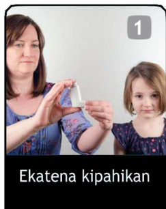
1 Ekatena kipahikan