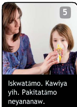
5 Iskwatāmo. Kawiya yih. Pakitatāmo neyananaw.