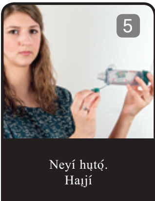
Neyı huıó. Haijí