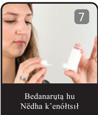
Bedanaruıta hu Nédha k'enoıtsıı

30 seconds hots'ın noruı?ıh 2-5 hulta k'e noıhuıá