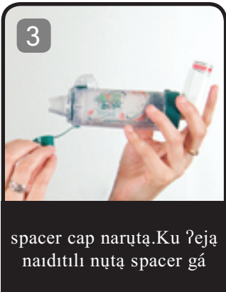
spacer cap naruıta. Ku ?eja naiditılı nuıta spacer gá