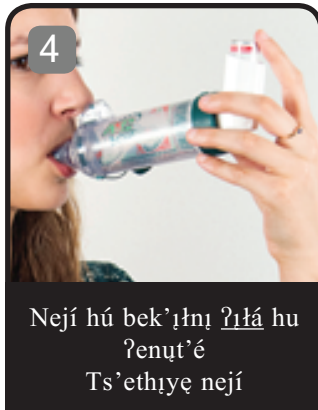
Nejí hu bek'ıhı ?ııá hu ?enuı'é Ts'ethıye nejí