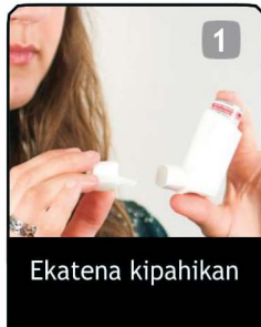
1 Ekatena kipahikan