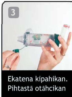
3 Ekatena kipahikan. Pihtastā otāhcikan