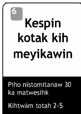
6 Kespin kotak kih meyikawin