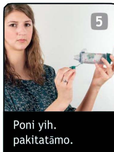
5 Poni yih. pakitatāmo.