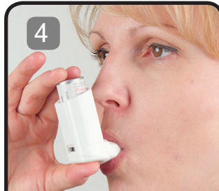
?édėhiı hu ?ı́łá yunı́ bek'ı́łnı́ Ts'ethıye nejı́