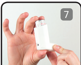
Bedánarı́ı hu tu ?a nedhá huthų́łhus

30 seconds ts'ėn norų́łh 2-5 k'e nothujá