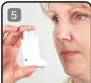
Nehı́łı́. Ts'ethıye hanéjı́