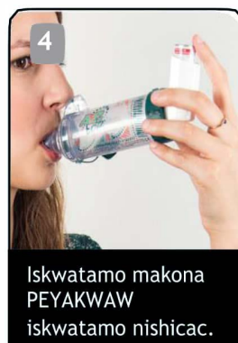
Iskwatamo makona PEYAKWAW iskwatamo nishicac.